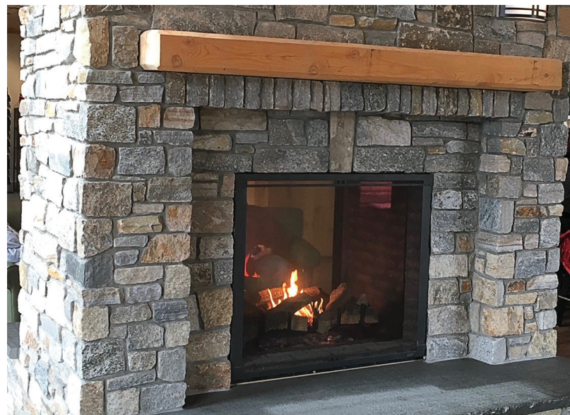
AB218 SPA 01/2021

Para usar fácilmente las Calculadoras de productos ARDEX y la Información sobre productos en cualquier lugar, descargue la aplicación ARDEX en iTunes Store o en Google Play.